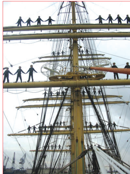
Тяжело в учении...

— В прошлом году на аналогичной конференции было заявлено об идее создания разобщенного технопарка. А сейчас мы уже приступили к созданию производственных кафедр на ведущих предприятиях: ОАО ПСЗ «Янтарь», ОАО «Лукойл»,