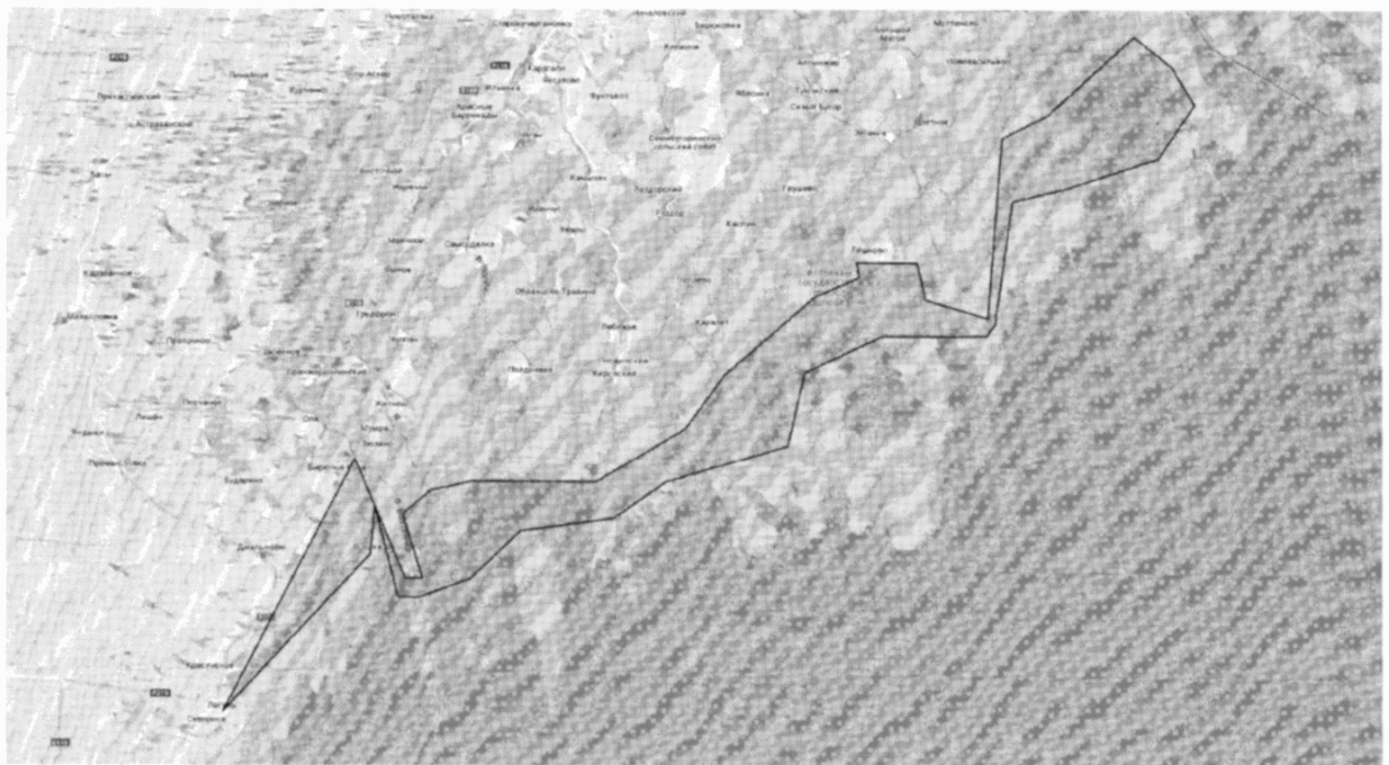
Схема Волжского предустьевого запретного пространства

Приложение N 4 к Правилам рыболовства для Волжско-Каспийского рыбохозяйственного бассейна, утвержденным приказом Минсельхоза России от 13 октября 2022 г. N 695