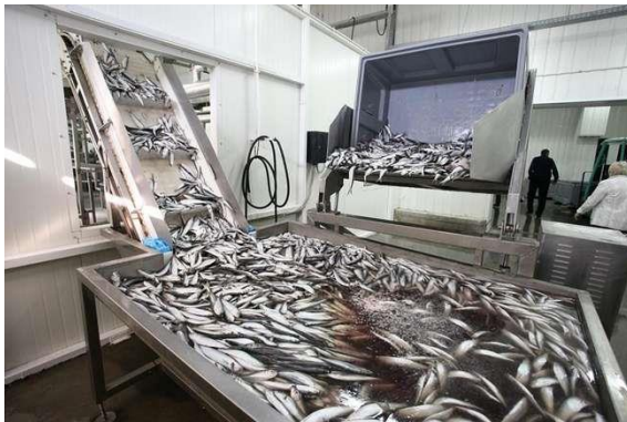
Задержка в сырце; Неполнота переработки; Нарушение технологии;