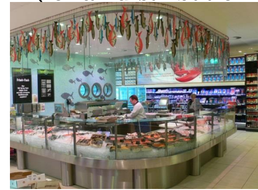
Overloading of the products; Expiration dates.