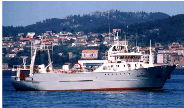
Выброс за борт при перелове, Отходы;