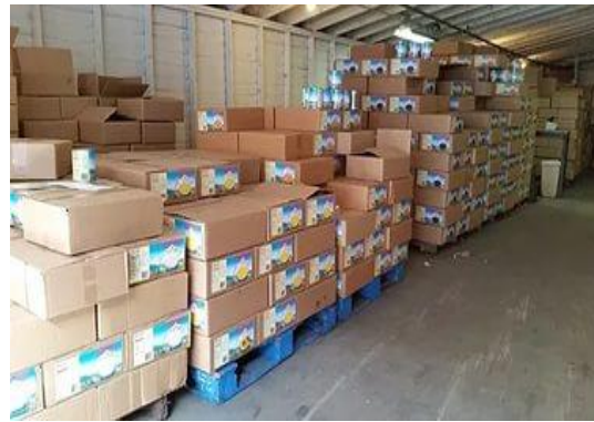
t температура; Сроки хранения.