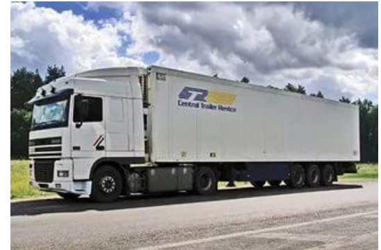
temperature (for all distribution chain)