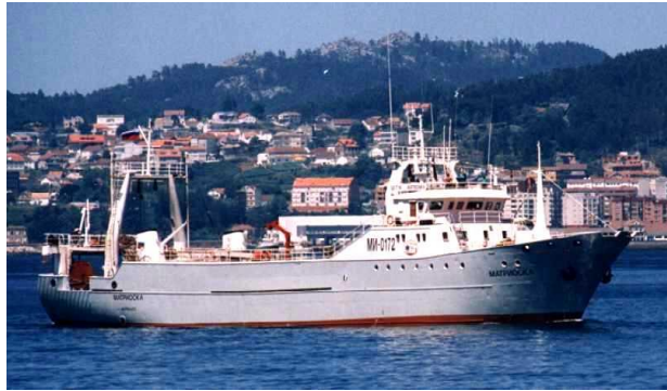
Discharge overboard during a fracture, Waste;