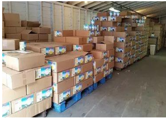
temperature; Terms of storage.