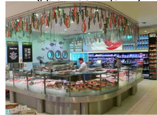
Перезаказ продукции; Сроки годности.